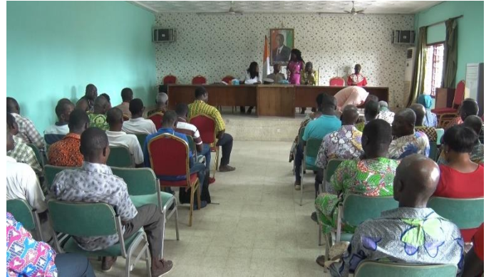
VUE DE L'ASSEMBLEE