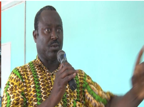
VUE DES POPULATIONS EXPRIMANT LEURS PREOCCUPATIONS