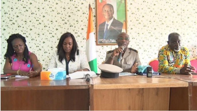
VUE DE LA TABLE DE SEANCE