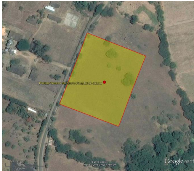
Figura 02 – Vista aérea del posible terreno para construir el nuevo HPJ

domésticos y hospitalarios, la municipalidad de Jalapa cuenta con un servicio de recolección de desechos sólidos diario, los cuales son depositados en el relleno sanitario de la ciudad. Durante la implementación del proyecto se asegurará que el relleno sanitario cuente con el respectivo sitio para almacenar y tratar desechos hospitalarios.