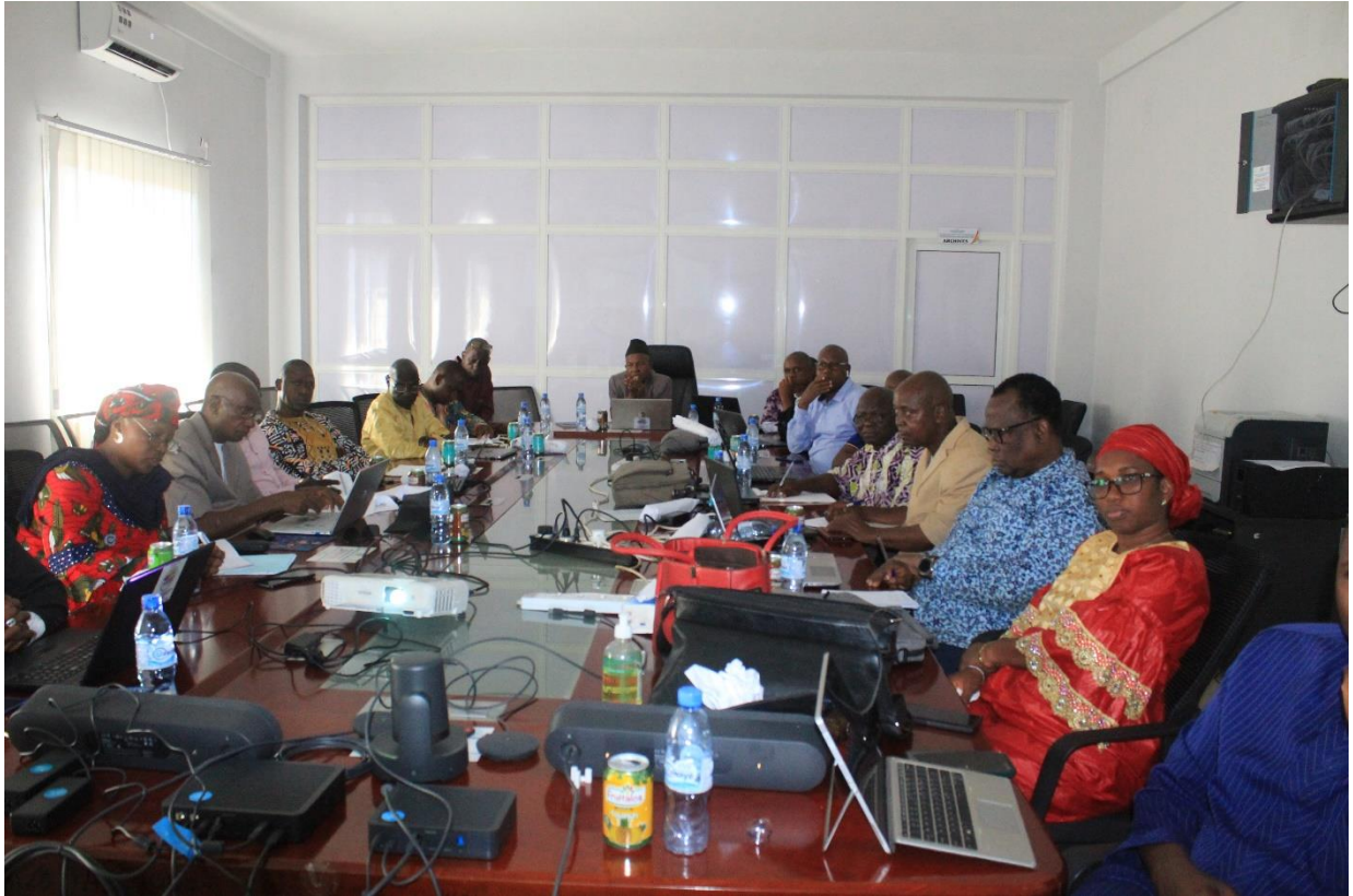
Figure 3 : Illustration des consultations publiques du niveau national au siège de l' UGP