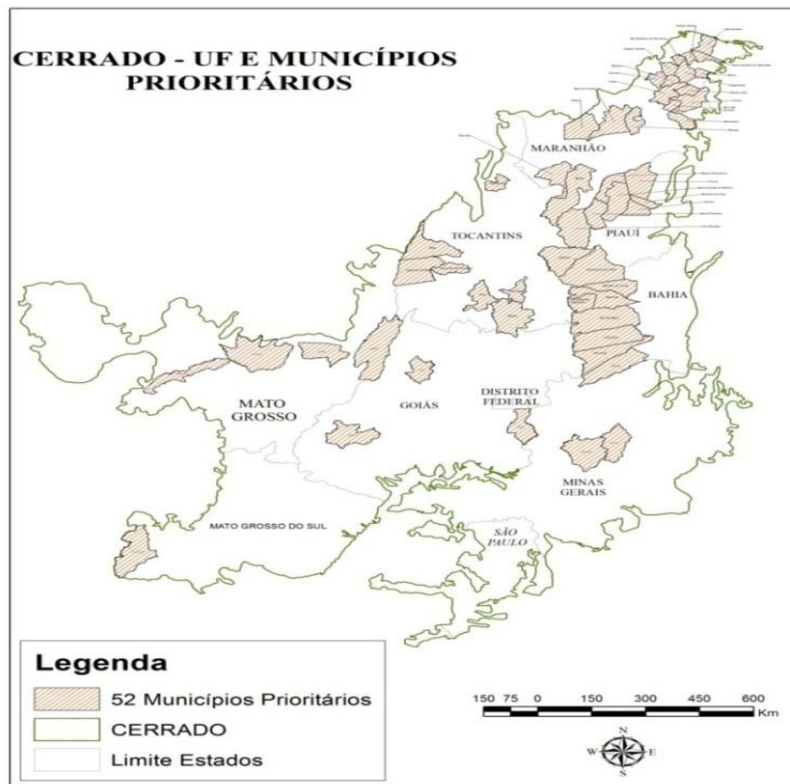
Figura 02. Localização dos municípios prioritários do Cerrado para o combate ao desmatamento, conforme Portaria MMA 97/12.

A partir de indicadores ambientais, econômicos e sociais selecionados com base nos critérios expostos anteriormente, foi possível elencar os seguintes municípios como prioritários: Formosa do Rio Preto, São Desidério, Riachão das Neves, Barreiras, Luís Eduardo Magalhães, Correntina, Jaborandi e Cocos.