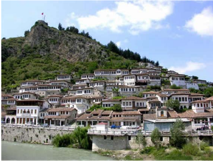
Figura 2.2: Pamje e Tabjes (lart) nga qyteti i Beratit