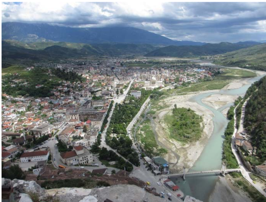
Figura 7: Lumi Osum dhe qyteti i Beratit

Qyteti i Beratit ndodhet në të dy anët e lumit Osum (Figura 7). Osumi është një nga lumenjtë kryesorë të Shqipërisë, i rëndësishëm për bujqësinë, hidroenergjinë, ekologjinë, turizmin dhe peisazhin.