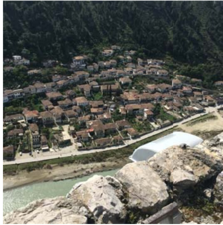
Figura 5: Pamje nga pika panoramike e Tabjes