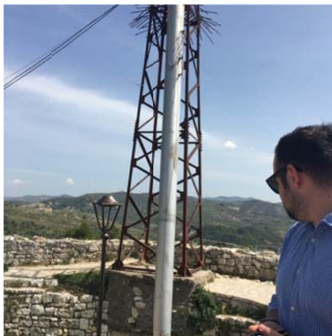
Figura 2.1: Pamje nga antenna qe do te largohet

Detajet e nderhyrjes tek pika panoramike e Tabjes perfshijne: Largimin e godines 1-kateshe te antenes, largimin e antenes, shtrimin me kalldrem te kesaj pjese, vendosjen e shufrave anesore mbajtese metalike, stola druri me structure metalike, kosha mbeturinash dhe teleskop.