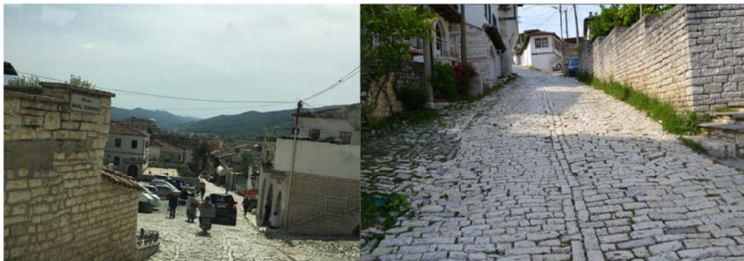
Figura 4: Pamje e rrugës ekzistuese në kushtet aktuale

Planimetria e projektit jepet në figurën 6.1, ku rruga “Mihal Komneno” është e ngjyrosur në të gjelber.