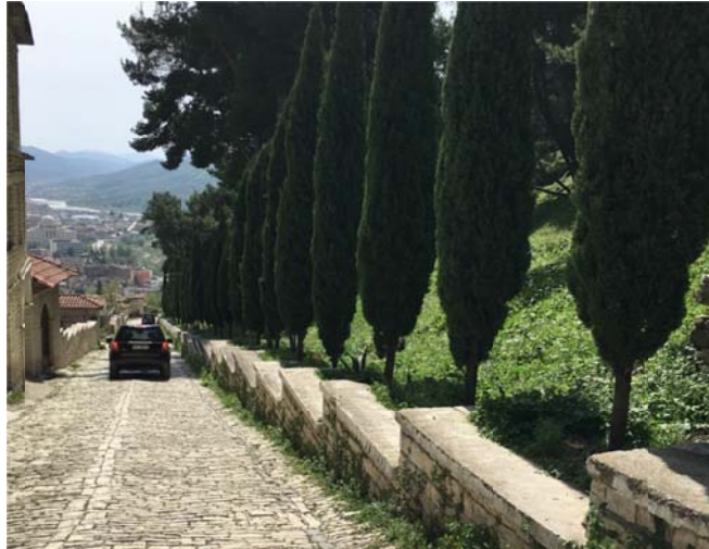
Figura 8: Peme selvie ekzistuese ne anet e rruges, te mbjella per arsye estetike