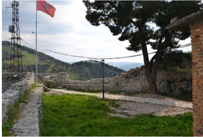
Figura 3: Pamje e ndertesës së antenës që do të largohet (ndertesa me tulla të kuqe)

Projekti teknik është kontraktuar nga Delegacioni Europian në Shqipëri, me përfutjes Ministrinë e Kulturës dhe Bashkinë Berat. Projekti është hartuar nga bashkimi i kompanive Safege+AAK+Atelier4, në Nentor 2014.