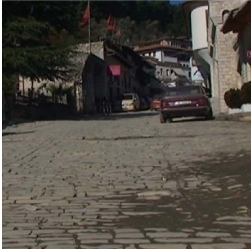
Figura 1: Pamje nga gjendja ekzistuese e rruges me kalldrem per ne Kalane e Beratit

Ne saje te arkitektures, trashegimise kultrore dhe ndertesave karakteristike, Berati eshte konsideruar nje nga qytetet me te bukura te Shqiperise prej dekadash. Berati eshte nominuar gjithashtu qytet UNESCO ne vitin 2008. Kalaja e Beratit eshte gjithashtu ne listen e Monumenteve te Kultures qe mbrohen nga ligji shqiptar. Kjo kala ndodhet permbi lumin Osum.