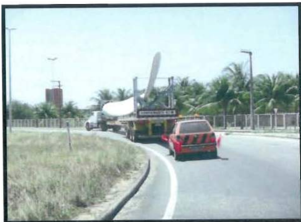
Figura 4.3 – Transporte da Pá