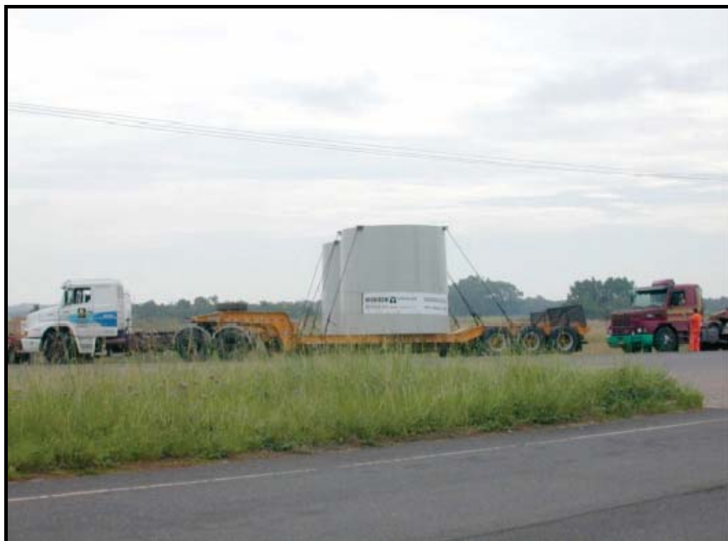
Figura 4.2 – Transporte de Segmento da Torre