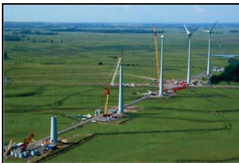
Figura 4.4 – Montagem dos Aerogeradores

O aerogerador é composto de 3 (três) pás e 1 (um) hub , com peso total de cerca de igual a 11 toneladas, uma nacelle onde fica abrigado o gerador constituída de material composto de fibra de vidro. A nacelle é orientável, rodando em torno de um eixo vertical, por forma a posicionar-se no azimute do vento dominante. Junto ao sistema são adicionados sensores de velocidade e direção do vento. Todo o sistema é acoplado à torre (Figura 4.4).