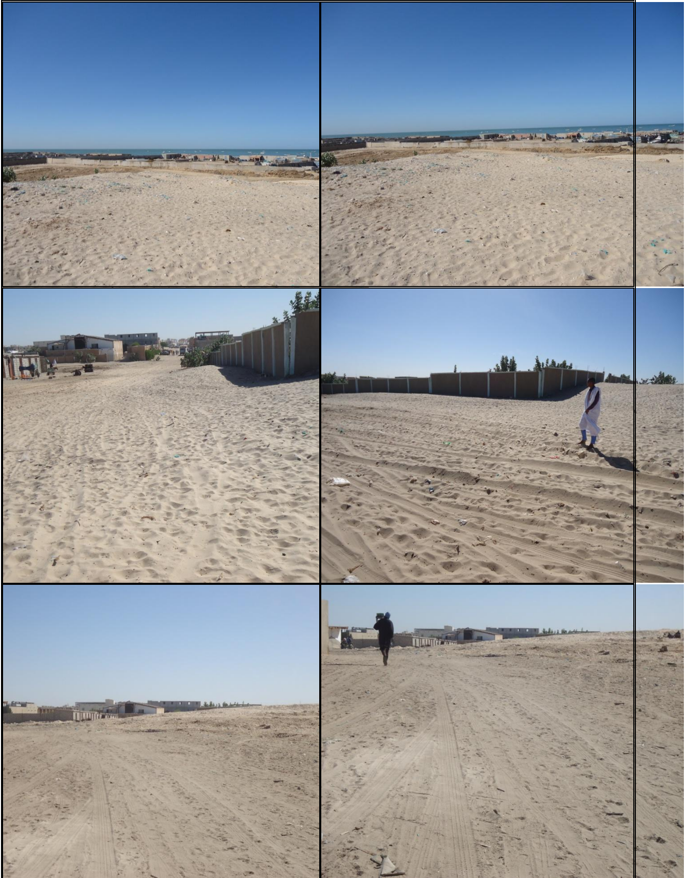
Photos des sites réservés aux infrastructures du PASP avec une vue des espaces publics environnants