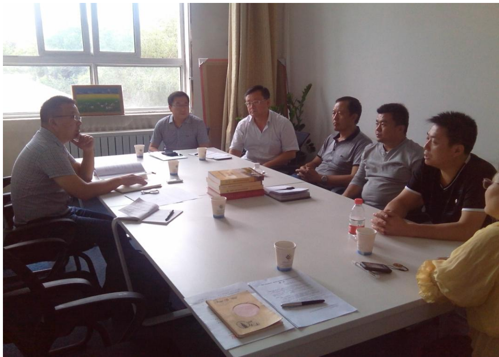
图 4-2 新疆农业职业技术学院教师座谈会