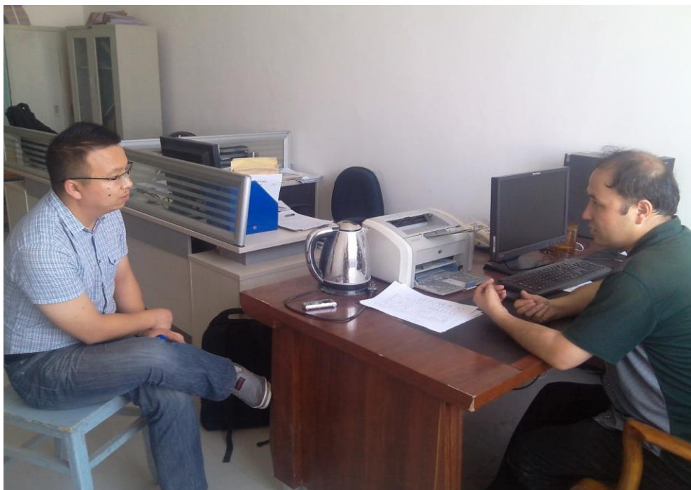
图 4-6 新疆维吾尔医学专科学校教师访谈