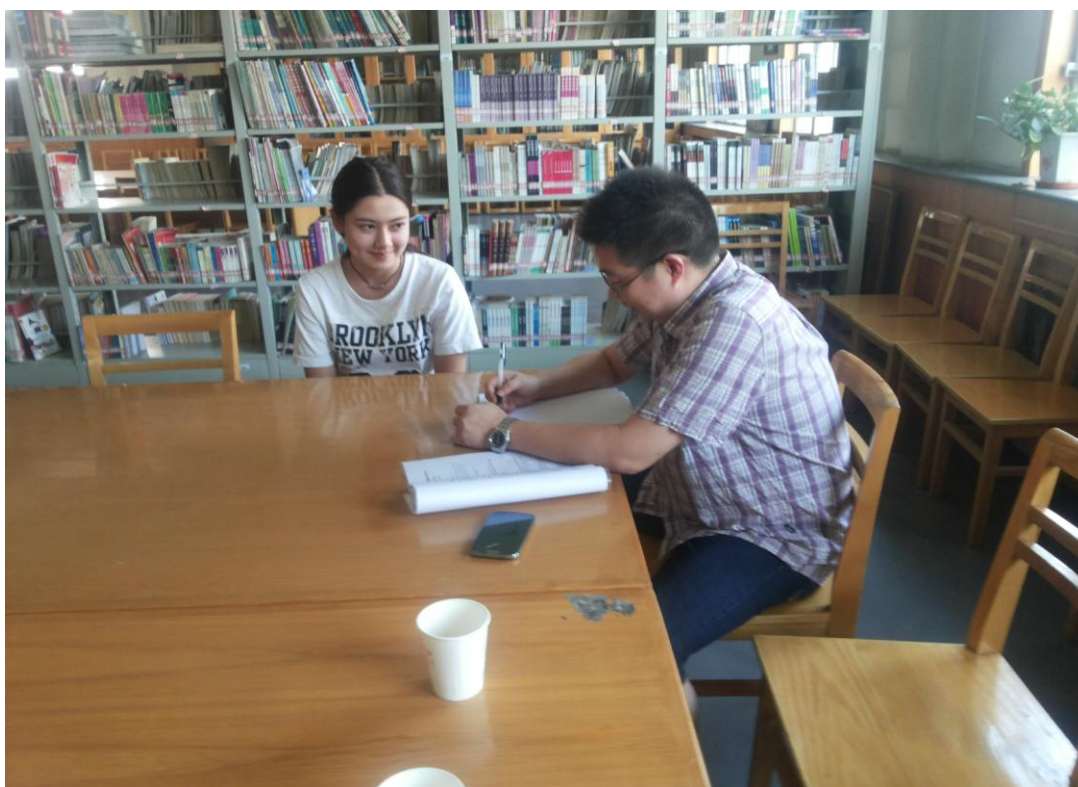
图 4-8 乌鲁木齐职业大学学生访谈