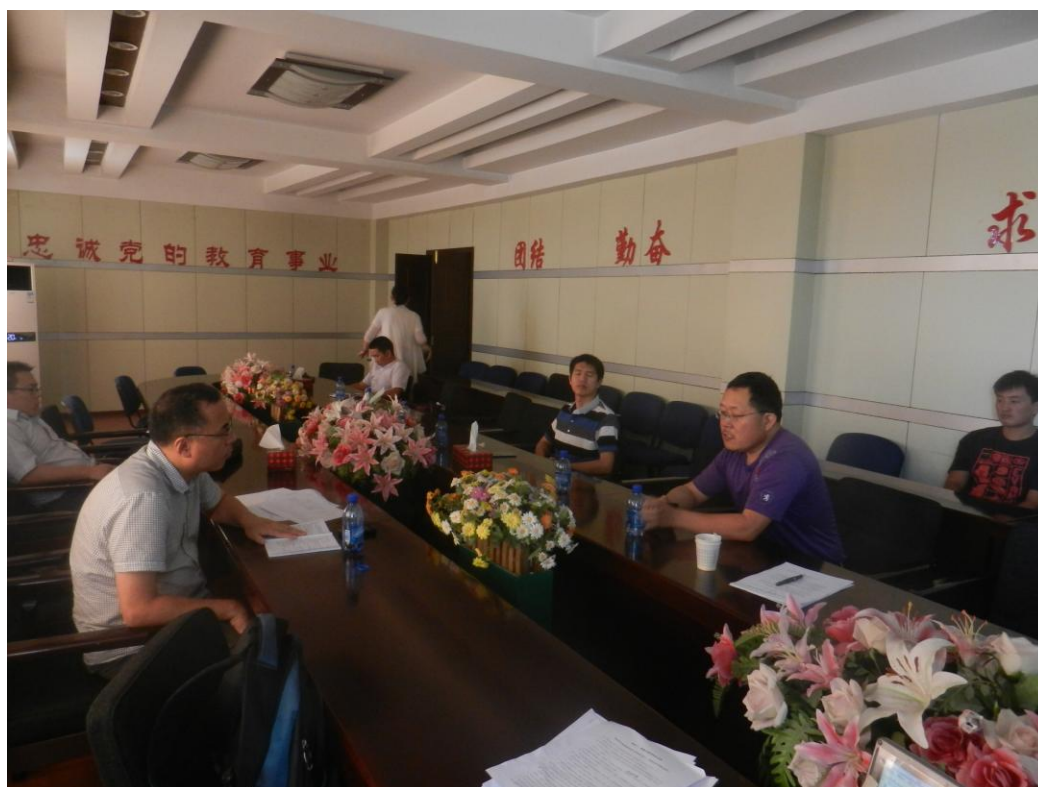
图 4-7 新疆轻工职业技术学院教师访谈