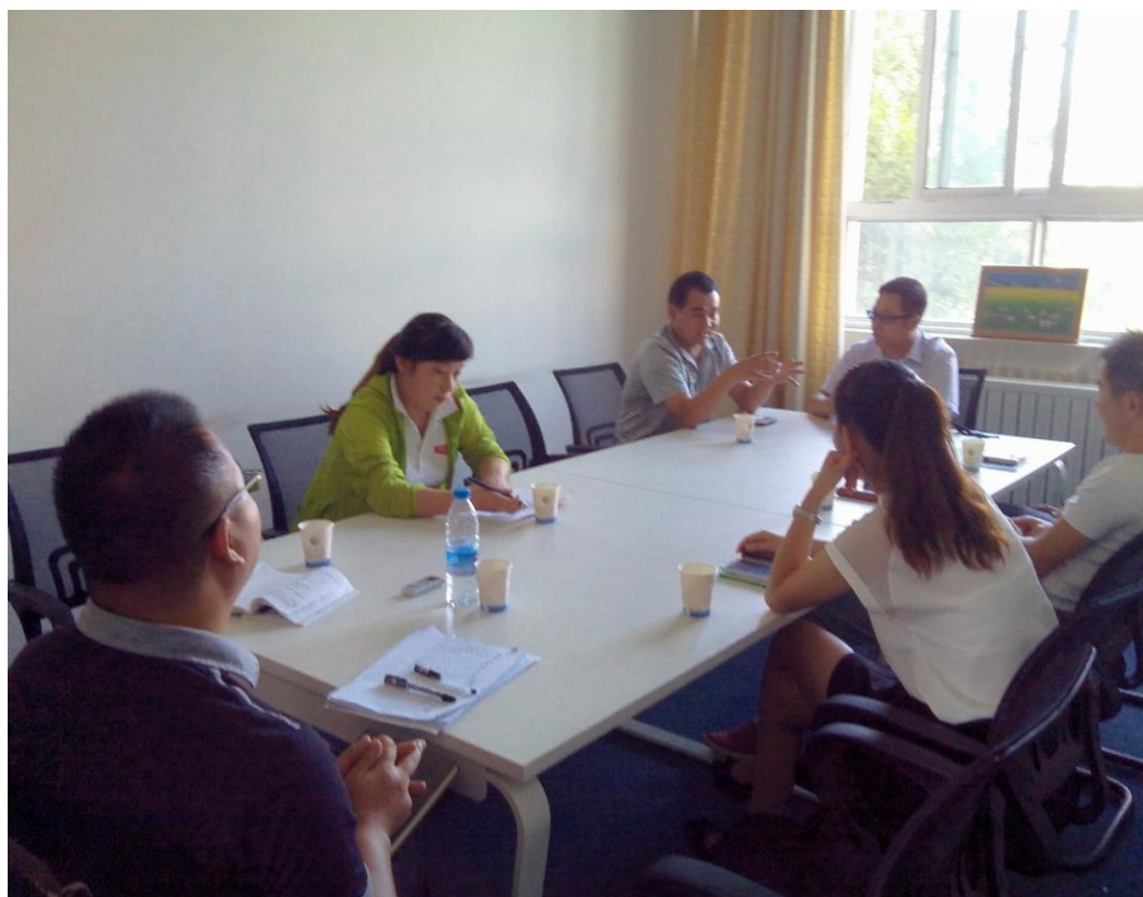
图 4-9 新疆农业职业技术学院学生访谈