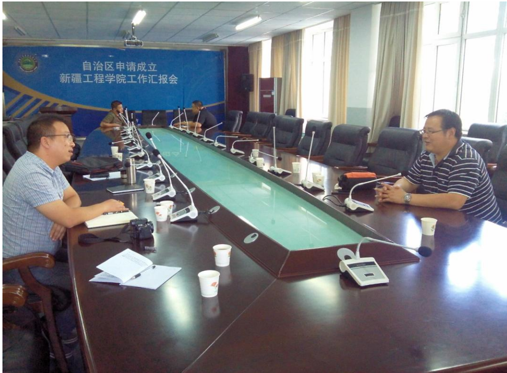
图 4-10 新疆工程学院教师访谈