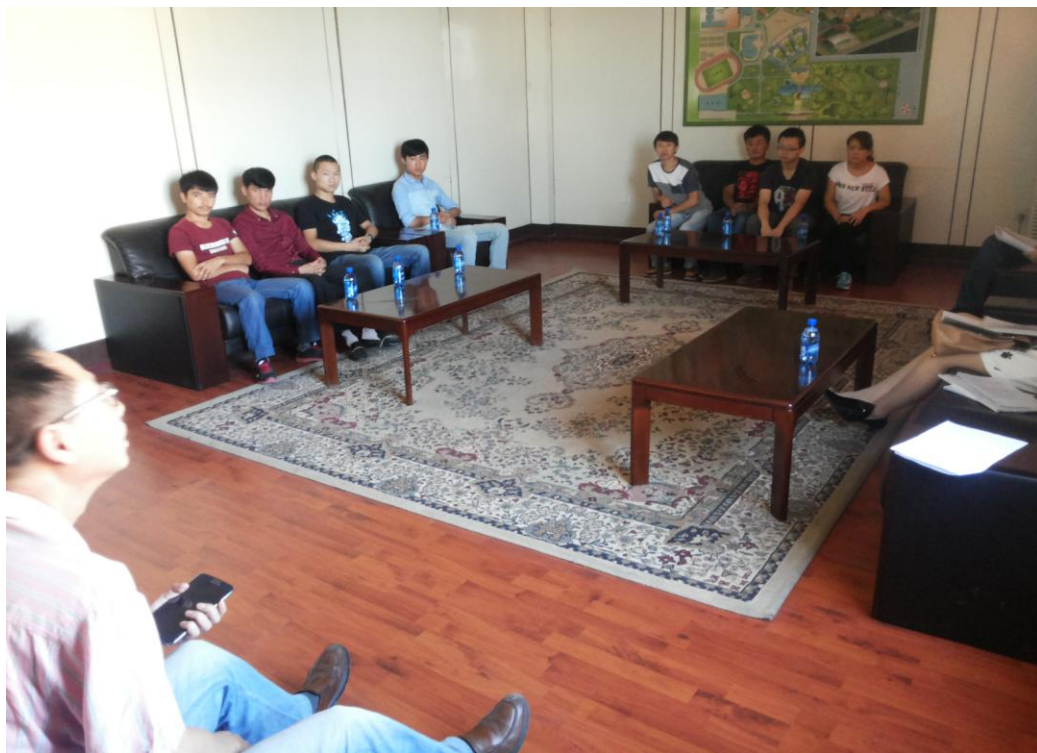
图 4-4 新疆轻工职业技术学院学生座谈会