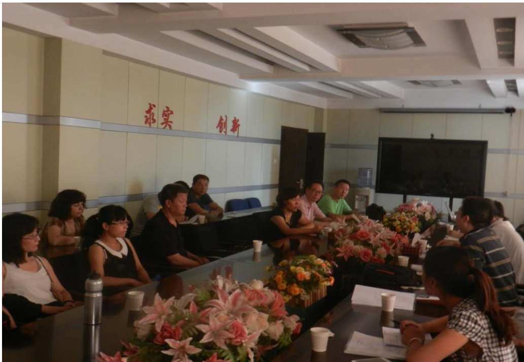
图 4-5 新疆轻工职业技术学院教师座谈会