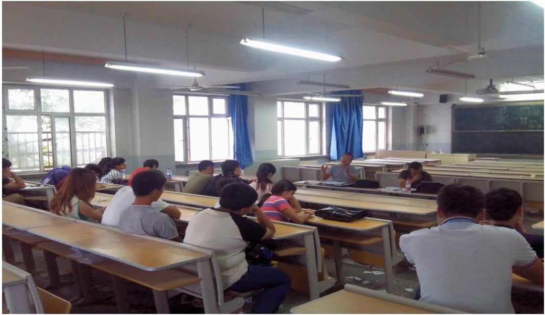
图 4-1 新疆工程学院学生座谈会