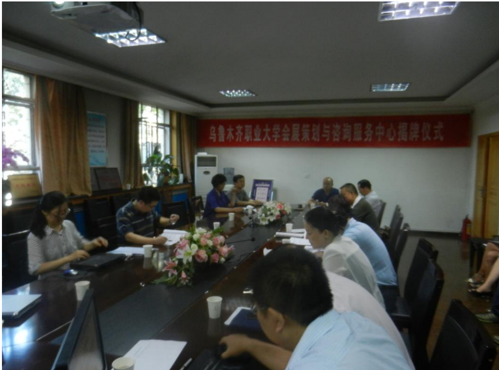
图 4-3 乌鲁木齐职业大学教师座谈会