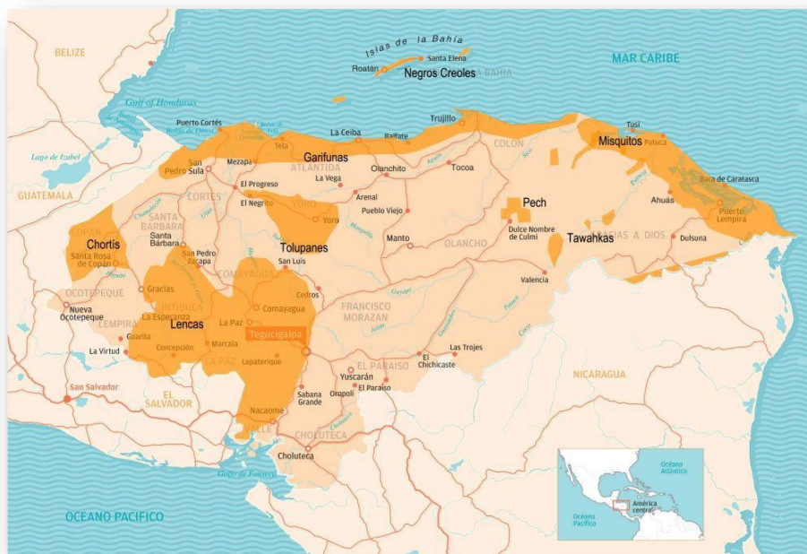
Figura 2: Ubicación de Pueblos Indígenas en Honduras

En los siguientes apartados se presentan las principales características de la población indígena y afrohondureña ubicada en las áreas de intervención del Proyecto.