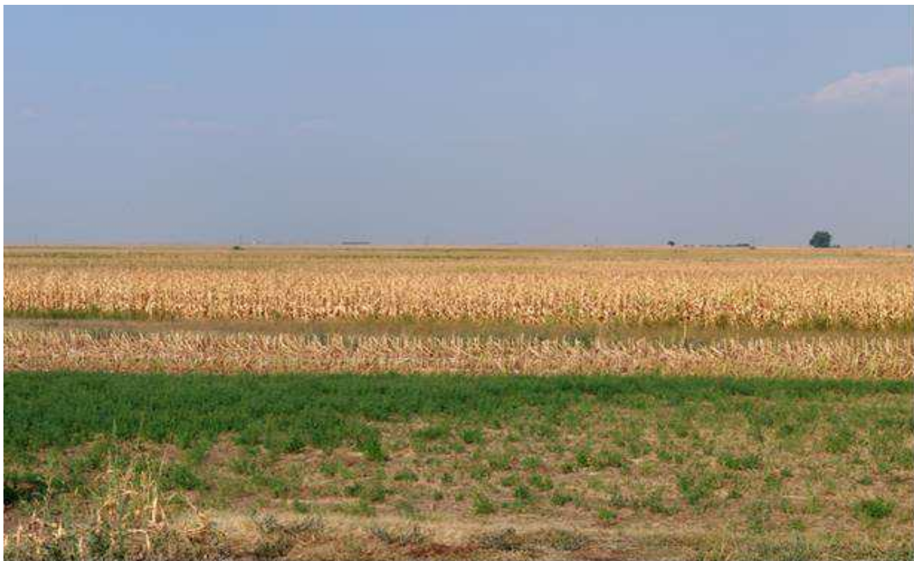
Slika 3 – generalni pogled na lokaciju Kovačica

Ne postoje nacionalno zaštićena područja u okviru granica lokacije. Postoji mali deo lokalno namenjene ekološke mreže u severoistočnom uglu lokacije, koja se nalazi duž Jarkovačkog puta (KOB07a i KOV07b).