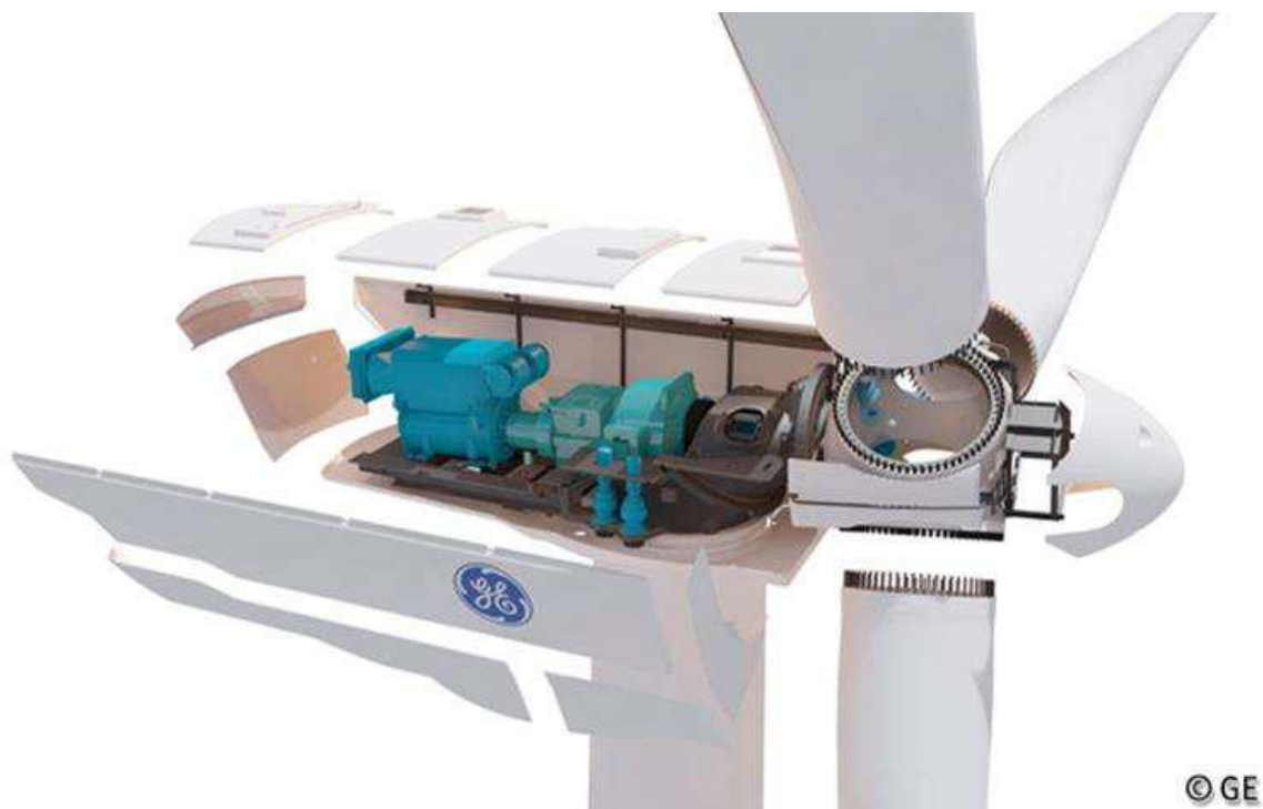
Slika 4 – turbina GE 2.75-120

Kompanija „Electrawinds“ instalira vetro turbine model GE 2.7-120, koje se snabdevaju energijom GE za proizvodnju čiste električne energije pretvaranjem energije vetra u električnu energiju. Ove turbine imaju kapacitet od 2.75MV i maksimalnu visinu turbine uključujući i lopaticu rotora od 169m. Ove turbine su manje od generičkih jedinica koje su razmatrane u originalnom EIA. Tip turbine koji je instaliran prikazan je na slici 3 dole: