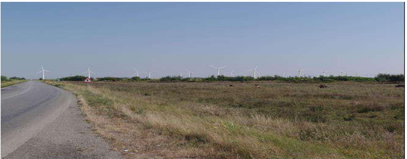
Slika 6: vizuelni prikaz lokacija sa puta Crepaja

Ne postoje vetroparkovi u vidokrugu predložene gradnje, osim predloga za niz drugih gradnji približno iste veličine u blizini. Priroda vetroturbina znači da postoje slabe mere ublažavanja koje su moguće za smanjenje njihovog vizuelnog efekta. Uvođenje vetroturbina bi stoga imalo uticaj na pejzaž lokacije i okolnih vizuelnih prirodnih lepota. Ovaj uticaj bi trajao tokom operativnog perioda vetroparka i nestao bi prekidom rada.