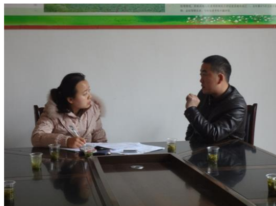
遵义市道真县洛龙镇大塘村关键信息人访谈