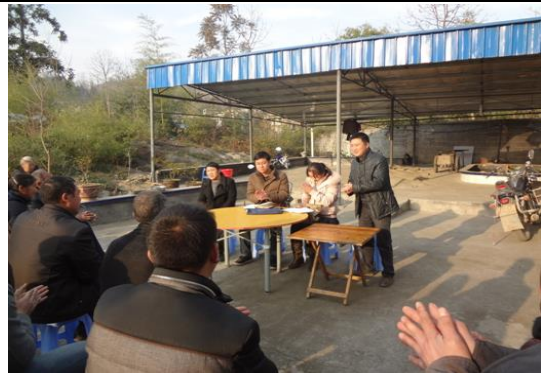
铜仁市沿河县官舟镇马脑村村民座谈会