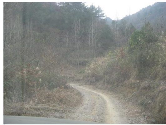
铜仁市石阡县石固乡仡比村入村道路