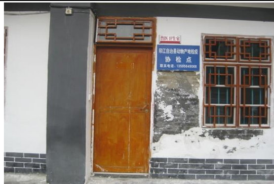
铜仁市印江县新业乡黔芙蓉绿壳蛋鸡养殖专业合作社