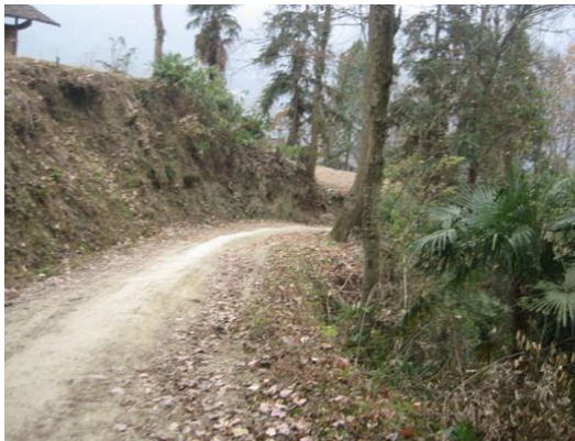
铜仁市石阡县石固乡仡比村产业道路现状