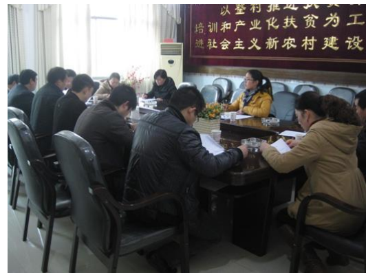
铜仁市德江县机构座谈会