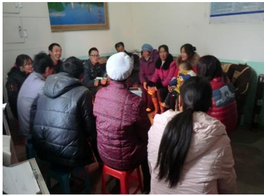
赫章县可乐乡可乐村村民座谈会