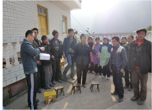
毕节市威宁县新发乡乐居村村民座谈会