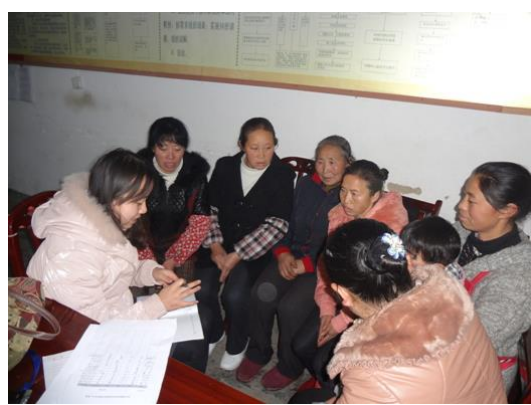
遵义市务川县丰乐镇田村村妇女座谈会