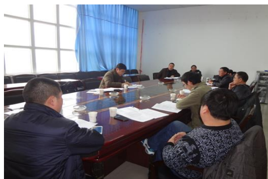
遵义市务川县机构座谈会