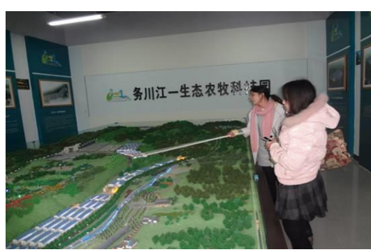
遵义市务川县江一龙头企业