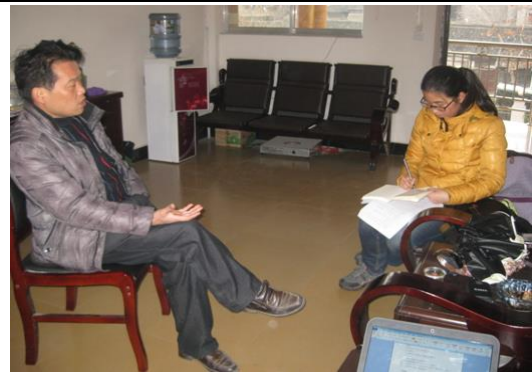
铜仁市印江县畜牧局访谈