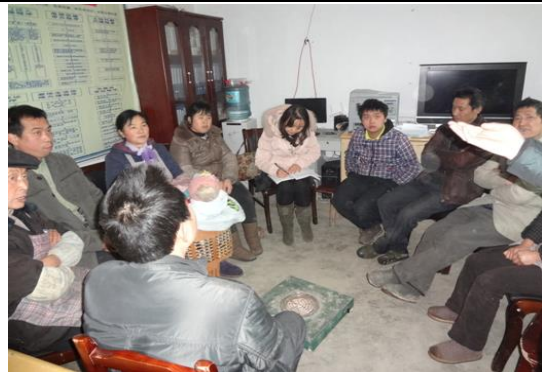
务川县丰乐镇茶坪村村民座谈会