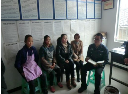
毕节市纳雍县猪场乡湾子村妇女座谈会