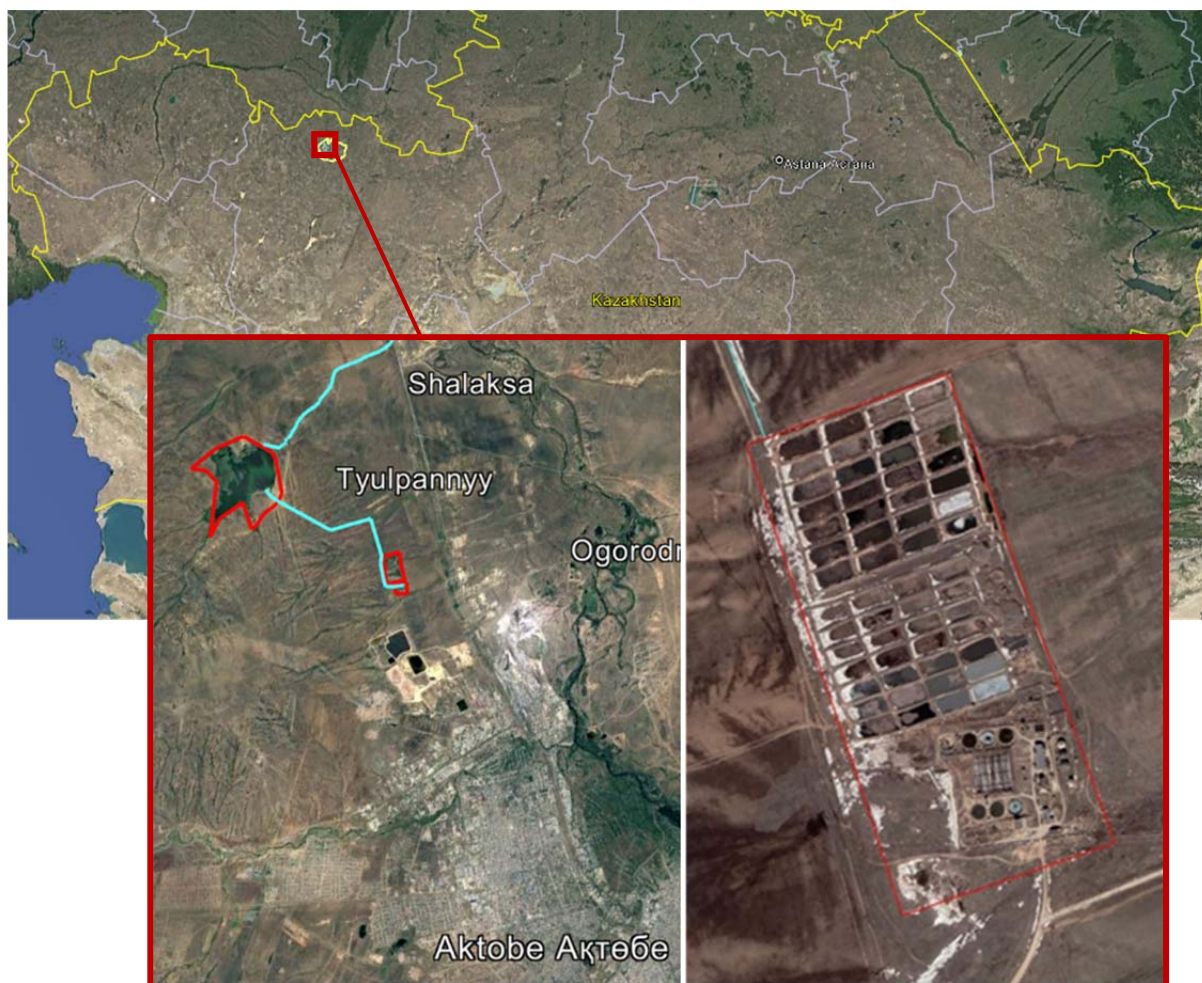
Сурет 2.1: Қазақстанның солтүстік-батысындағы Ақтөбе қаласының солтүстігінде орналасқан Ақтөбе ағынды суларды тазарту қондырғысы мен тазартылған ағынды суларға арналған резервуардың (URE) орналасқан жері

Аqtobe Su Energy Group Ақтөбе қаласы үшін қолданыстағы КТҚ-ға іргелес 11 гектарға жуық алаңда жаңа КТҚ салуды жоспарлап отыр. Бұл алаң Ақтөбе қаласының орталығынан солтүстік-батысқа қарай 5 км жерде орналасқан.