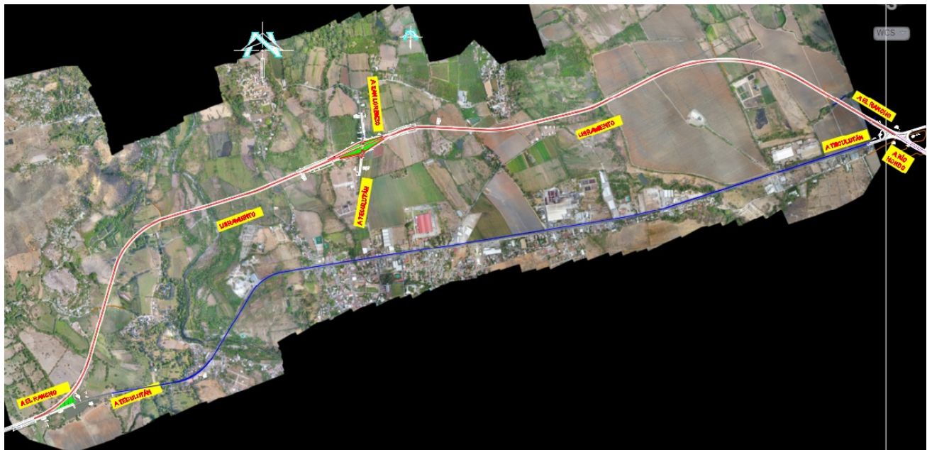
Libramiento de Teculután entre las estaciones 118+686 y 125+595 (6,91 km) al norte de la vía actual