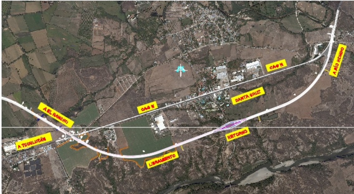
Libramiento de Santa Cruz entre las estaciones 125+595 y 129+425 (3,83 km) al sur de la vía actual