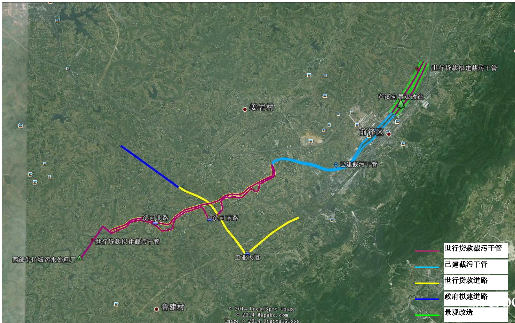
图 1.1-2 项目位置关系图