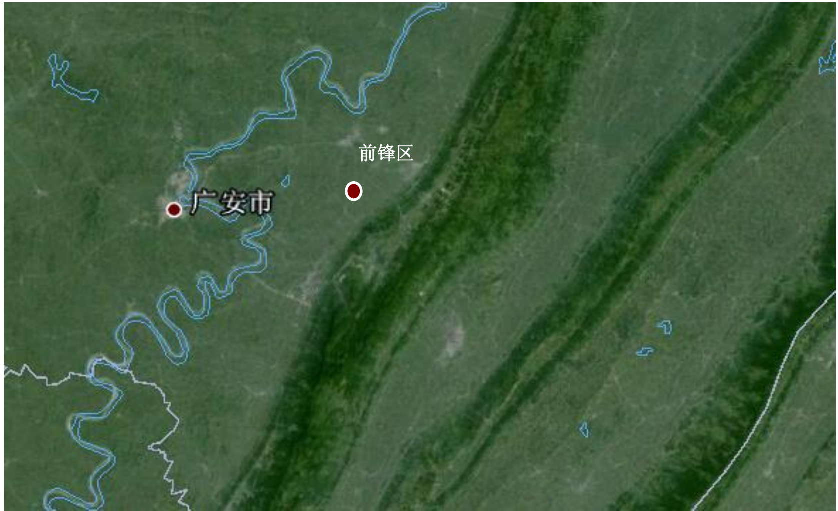
图 1.1-1 项目地理位置图