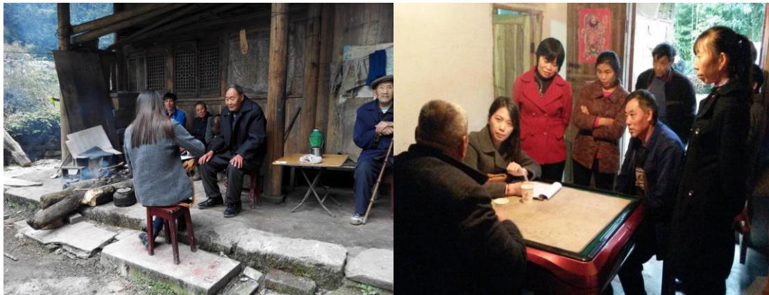
图 9-1 移民公众参与和协商现场