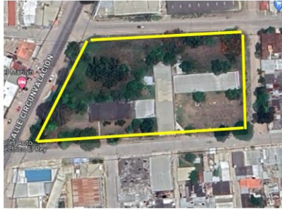
Terreno de la SETRASS en Danlí