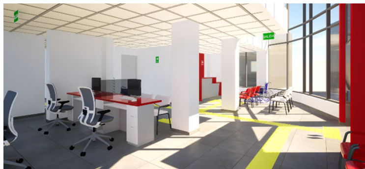
Ambientes interiores abiertos, modernos, accesibles, confortables.