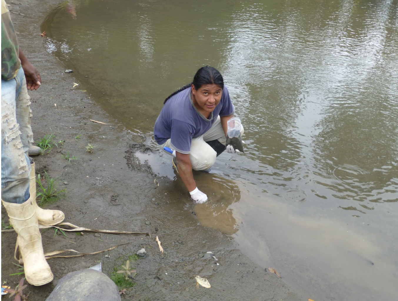
Estero de Los Monos Aguas Abajo