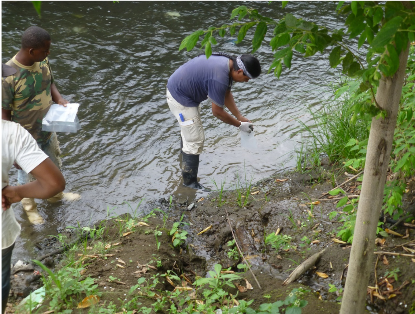
Estero de Los Monos Aguas Arriba