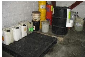
Fuelle: uso autorizado por ANCA,S.A de C.V