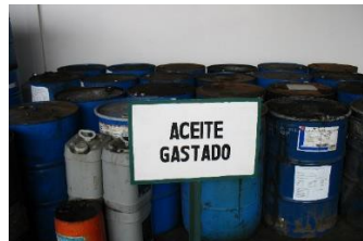
Fuelle: uso autorizado por ANCA,S.A de C.V