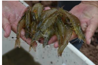
fuelle: Banco de fotos FND