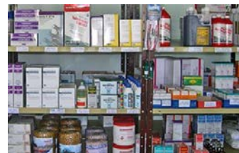
Fuelle: uso autorizado por ANCA,S.A de C.V