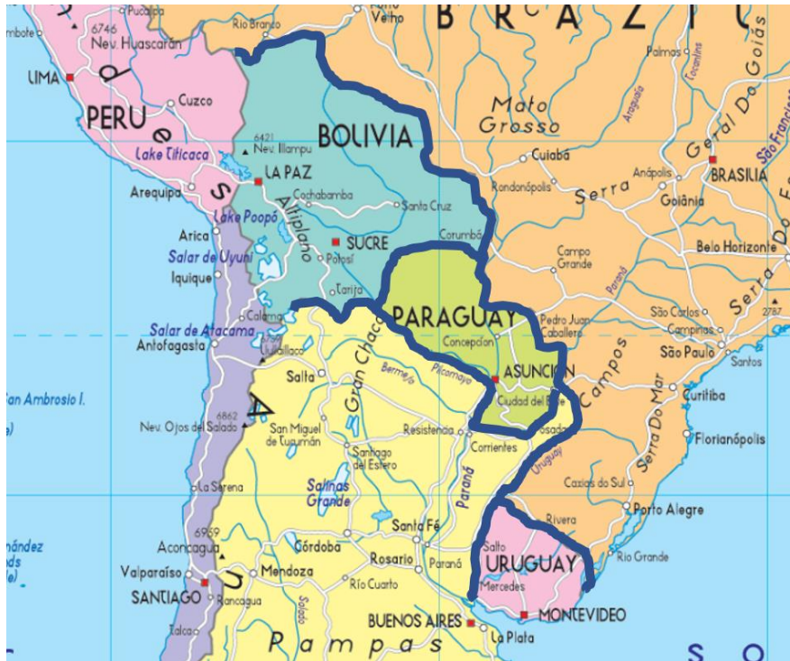
Imagen 1. Zona de Intervención en Fronteras