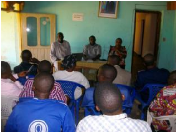
Consultation publique à Beni