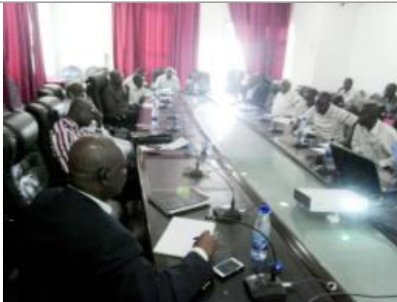
Consultation publique à Goma