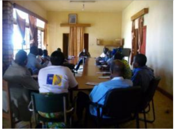
Consultation publique à Bunia