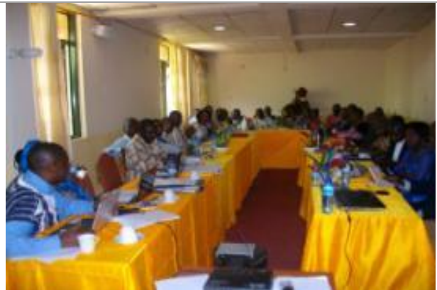
Consultation publique à Bukavu