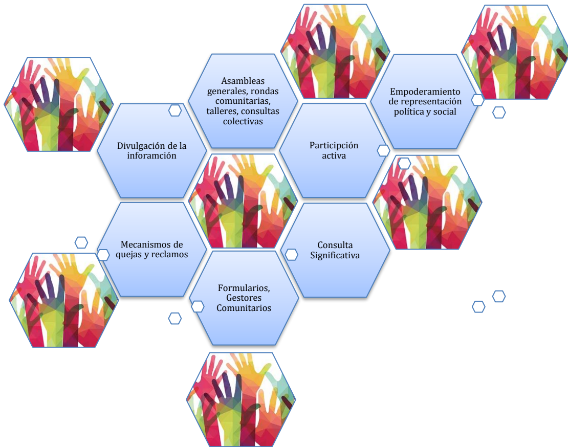
Gráfico 4-1 Gráfico de Plan de Acción Multidisciplinario