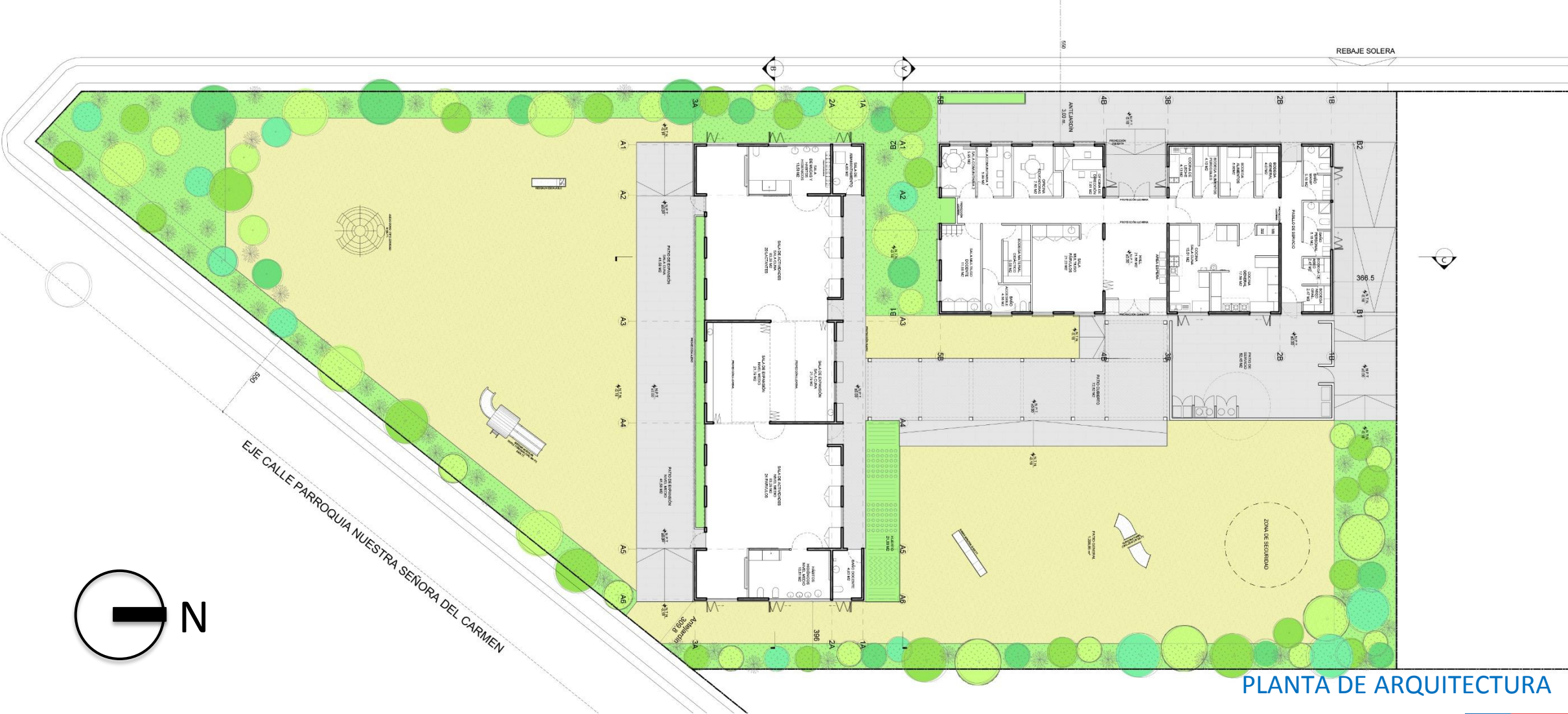
PLANTA DE ARQUITECTURA