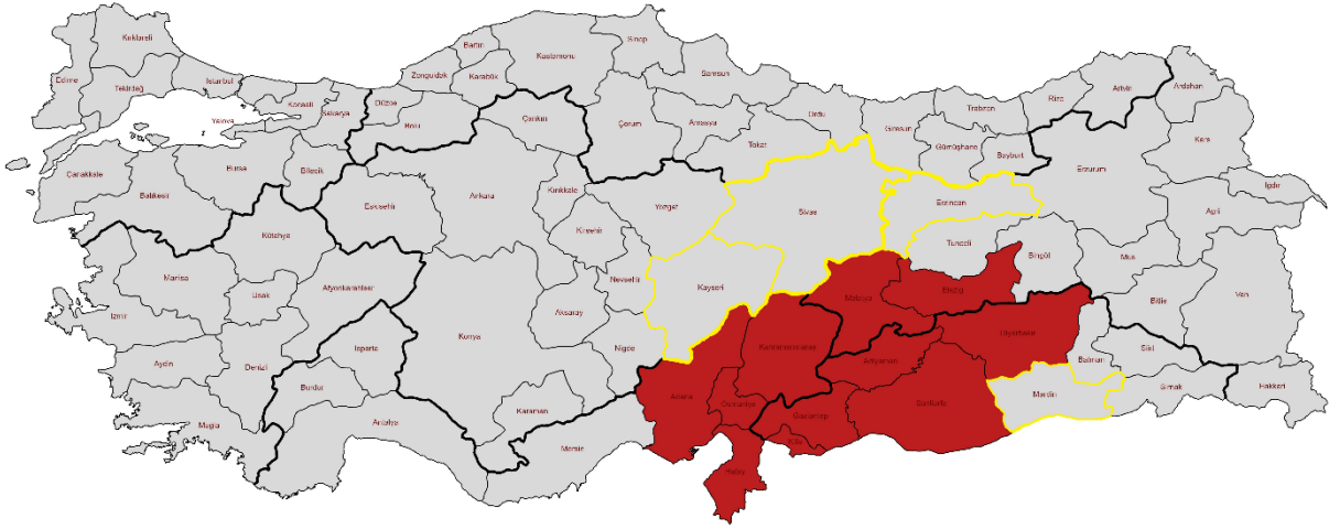
Şekil 2: Proje Uygulama İlleri 3

Tarım sektörü, depremden etkilenen illerin sosyo-ekonomik yapısının önemli bir ayağını oluşturmaktadır. "Bereketli Hilal" olarak bilinen bölge, tarımsal üretim, gıda sanayi ve tarımsal geçim kaynakları açısından kritik öneme sahiptir ve tarım ve ormancılık sektörünün ülke genelinde yarattığı değerlerin yüzde 15,3'üne katkıda bulunmaktadır. Türkiye'deki çiftçilerin yaklaşık yüzde 14'ü deprem bölgesinde yer almaktadır. Şubat 2023 depremleri tarımsal gıda tedarik zincirlerinin tüm segmentlerini