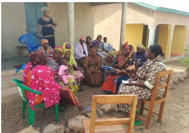
Photo 3: Consultation avec les femmes du village de Leynebé dans la préfecture de Labé

Education – Communication (IEC) à travers les radios locales et les posters. Les photos ci – après illustrent quelques images des acteurs rencontrés lors des consultations publiques dans la zone du projet.