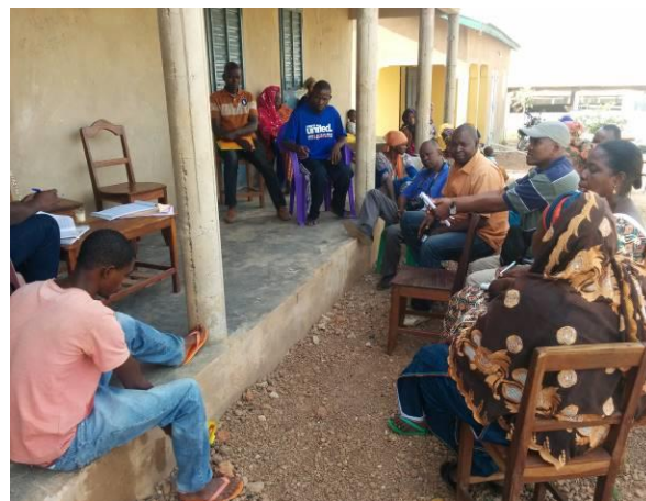
Photo 4 :Consultation publique avec la population de Leynebé dans la préfecture de Labé