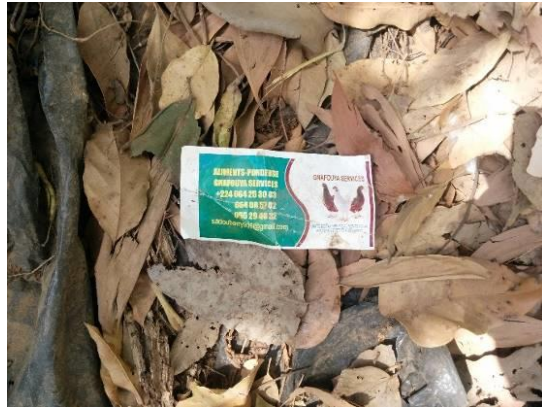
Planche 1 ; Emballage d'aliment et vitamines utilisés dans l'aviculture abandonné dans la nature