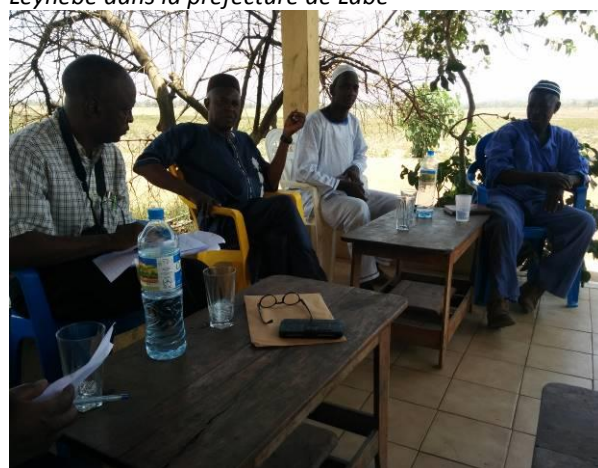
Photo 6 : Consultation avec des riziculteur du village de Denken dans la prefecture de Boké

Il ressort des entretiens et interviews les constats suivants :