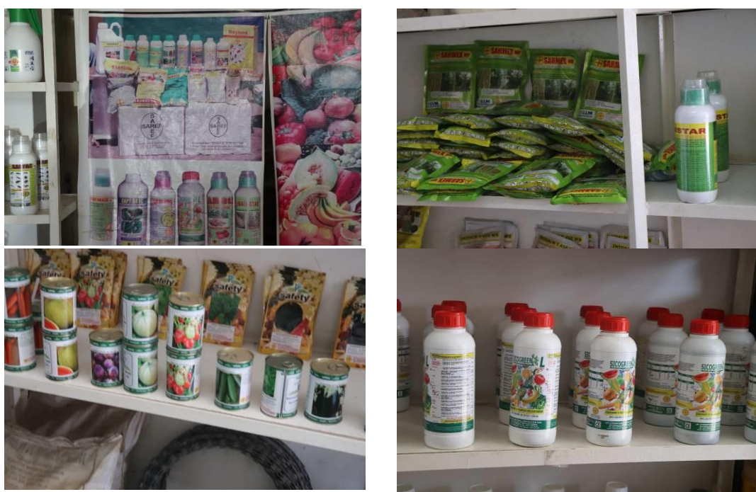
Planche 2 : Magasin de vente de produits phytosanitaires à Conakry

Concernant les producteurs qui appartiennent à une Organisation Paysanne, l'acquisition de produits phytosanitaires s'opère par l'intermédiaire de l'organisation ou par la fédération qui l'acquière, des Sociétés spécialisées dans la fabrication et/ou distribution des produits phytosanitaires. Ces Sociétés fournissent au moins 44% des pesticides du marché.