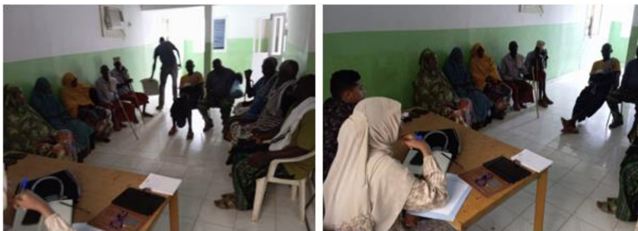
Fig. : Rencontre avec les communautés à Oueah/Wea

L'équipe a pu apporter certaines réponses surtout aux questions liées aux accidents. En effet, il a été expliqué qu'après la construction, des mesures sécuritaires seront prises afin de réduire les accidents.