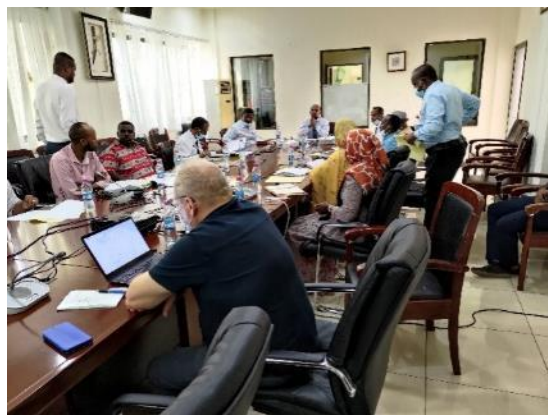
Rencontre avec les Parties Prenantes à Djibouti ville