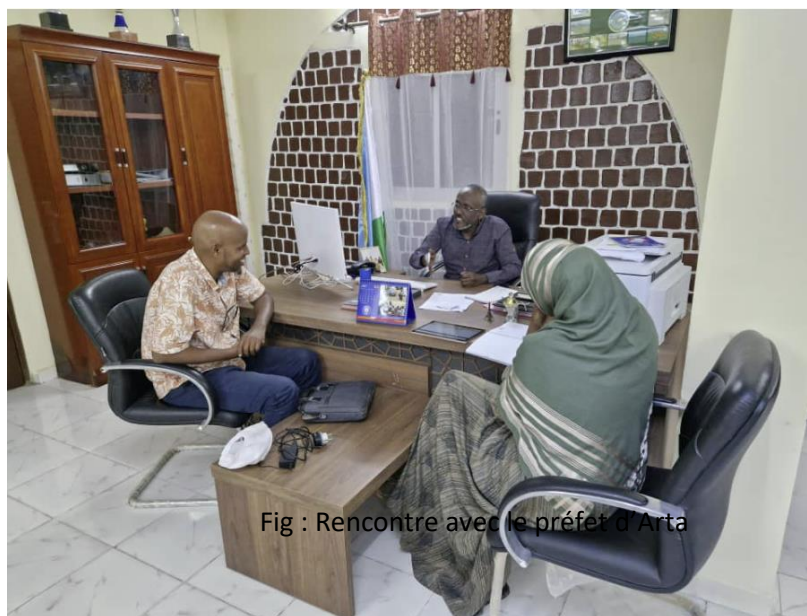
Fig : Rencontre avec le préfet d'Arta

Les préoccupations et les contributions des autorités locales seront prises en compte dans la suite du processus de planification et de mise en œuvre du projet.