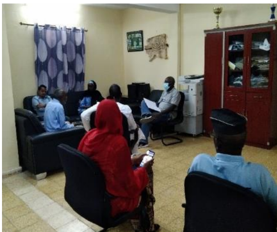
Rencontre avec les Parties Prenantes à Arta

Djibouti ville : organisée le 12 août 2021 par le DG de l'ADR en personne, cette réunion a permis de rassembler la majorité des parties prenantes institutionnelles liées à la composante 1 17 participants dont quatre femmes (voir liste de présence en annexe). En effet, hormis les services étatiques impliqués dans la gestion des routes, de l'environnement et des représentants du syndicat des transporteurs on retrouvait également des représentants des entités territoriales. Au début de la rencontre, Le DG de l'ADR a pris la parole pour souhaiter la bienvenue aux participants et expliquer le but de cette rencontre afin d'éviter tout débordement. C'est après cela qu'il a donné la parole aux consultants.