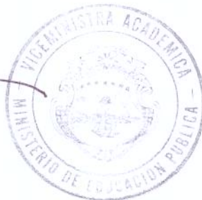
Dyalah Calderón Viceministra Académica

Con las muestras de mi más alta estima y consideración, se suscribe cordialmente