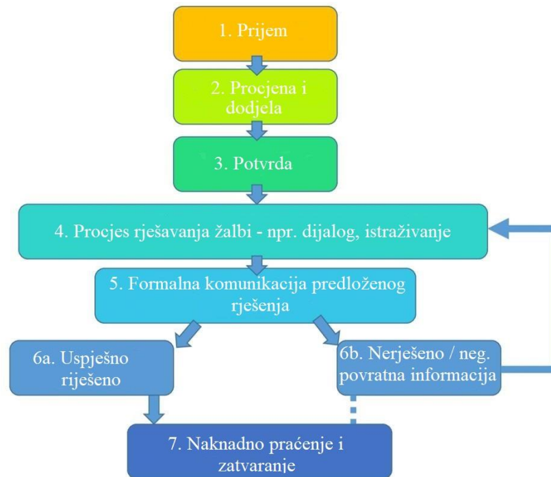
Slika 3 Proces rješavanja žalbi