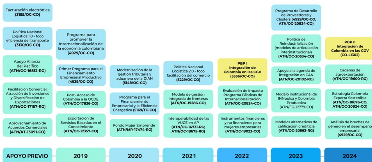
Gráfica I. Apoyo del Banco a la Integración Competitiva a de Colombia en las CGV

● Actividades apoyadas por Préstamo ● Actividades apoyadas por CT